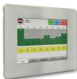
Écran tactile RHINO